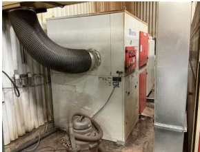
Table de découpe au laser à contrôle numérique (CNC), comprenant : Table de découpe au laser, 7' x 13', puissance laser, 6 kW Panneau de contrôle Aspirateur de fumée "Vanterm", mod. : PL-4000 Cabinet électrique "Winhee", mod. : EA-300 Refroidisseur "S&A", mod. : CWFL-6000 Source laser "IPG Laser", mod. : 6000U YLS Transformateurs Etc.